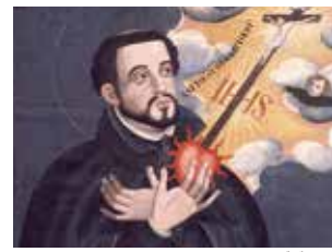
フランシスコザビエル

1565 (永禄8年) 天草五人衆の一人、志岐城主志岐鎮徳、イエズス会宣教師派遣を要請