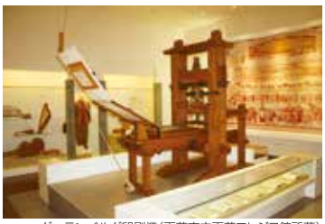
グーテンベルグ印刷機(天草市立天草コレジヨ館所蔵)