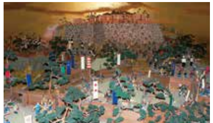
天草・島原の乱ジオラマ(天草四郎ミュージアム)