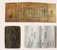
天草市立天草ロザリオ館所蔵

徳川家康によって江戸幕府ができると、キリシタンの弾圧が強化されました。そのため、宣教師の追放、教会の破壊、キリシタンの処刑などの大迫害がはじまり、長崎をはじめ多くの殉教者が出ました(P13~)。