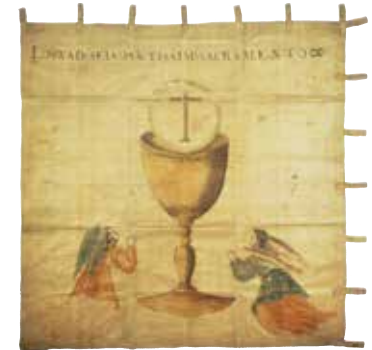
天草四郎陣中旗(天草市立天草キリシタン館所蔵)