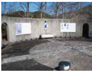
天草コレジヨ跡公園