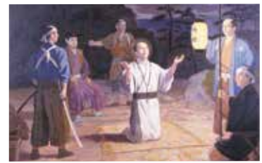
アダム荒川殉教図(天草市立天草キリシタン館所蔵)