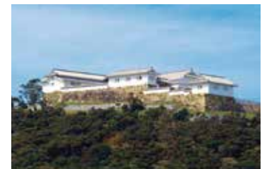
富岡城跡