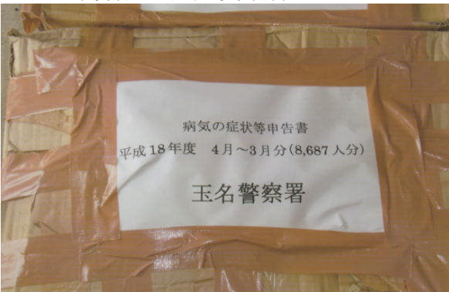
平成18年度病気の症状等申告書