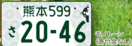
モノトーン (寄付金なし)