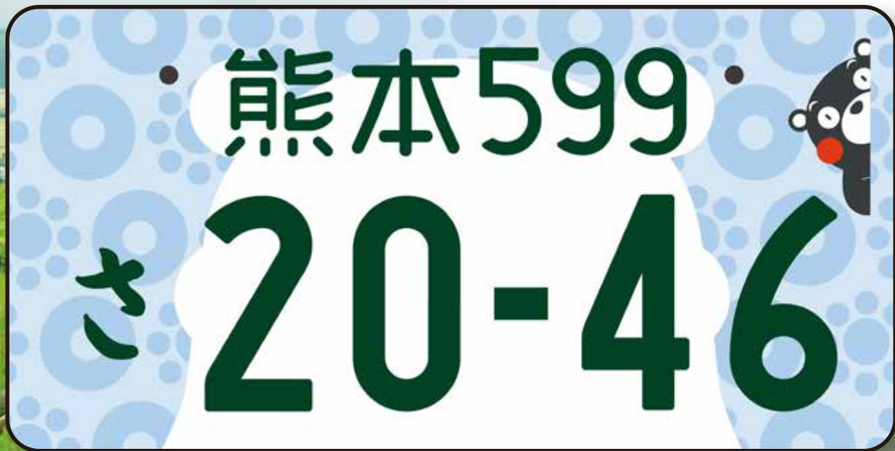
フルカラー(寄付金あり)