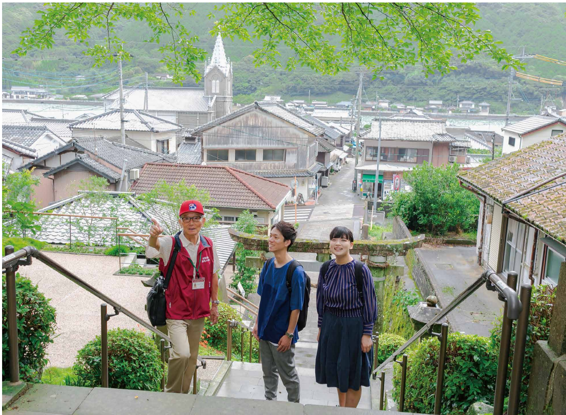
崎津諏訪神社から臨む集落。奥に見えるのは崎津教会。