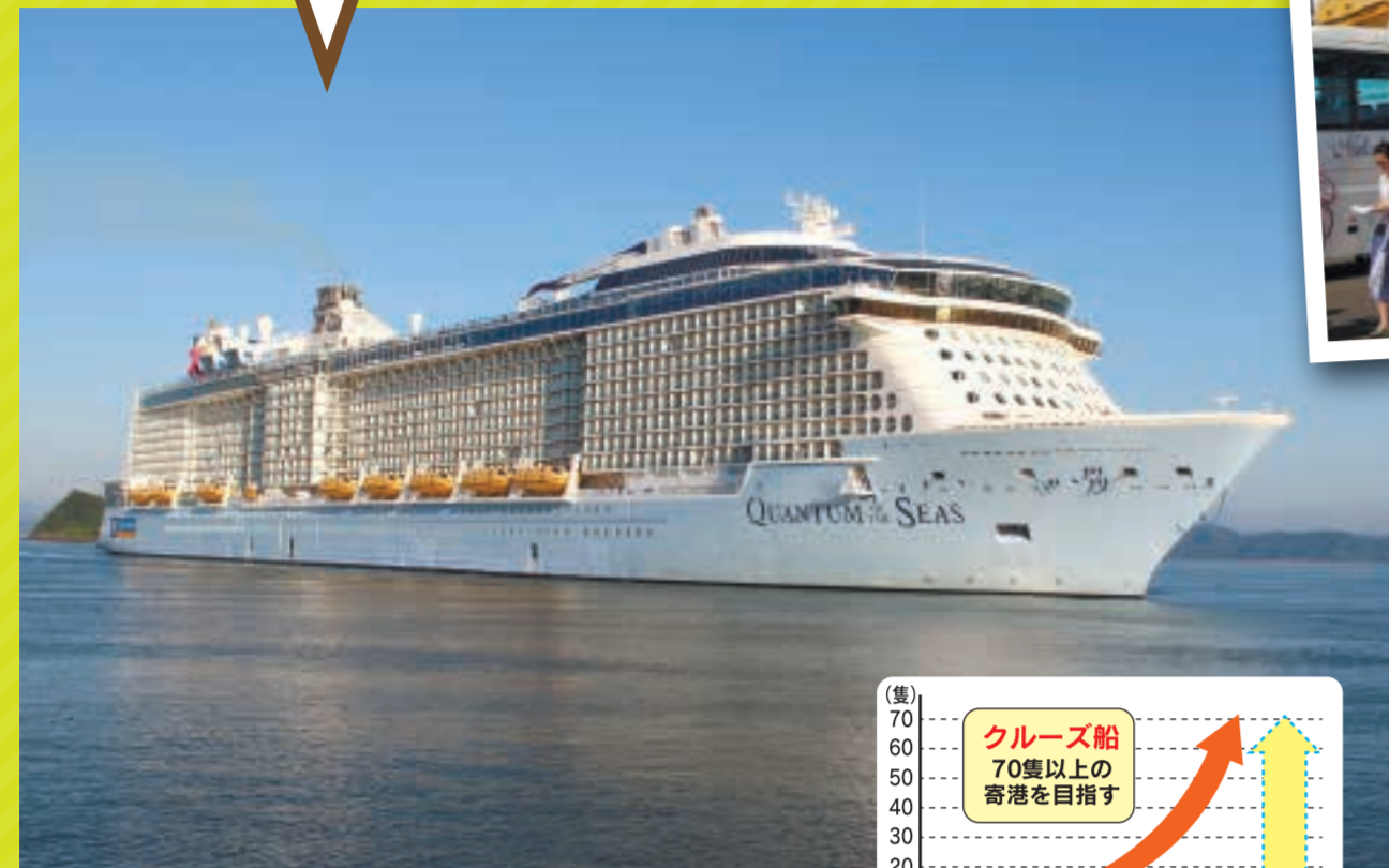
7月、八代港に熊本地震発生後、初入港した大型クルーズ船「クワンタム・オブ・ザ・シーズ」