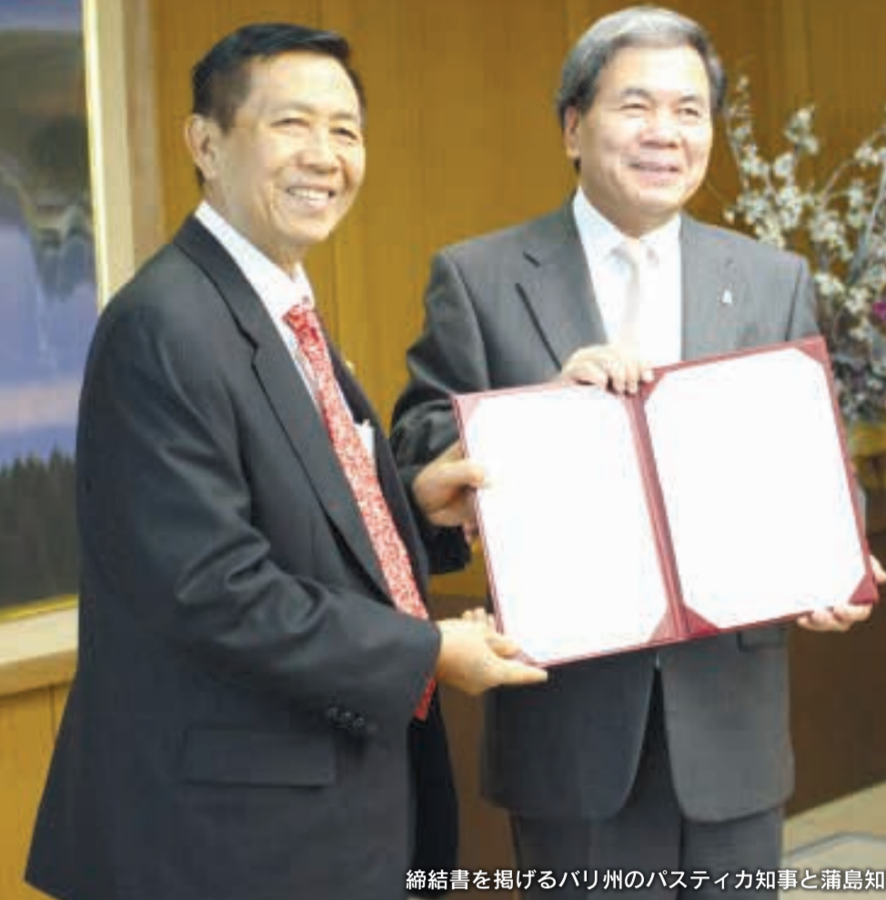
締結書を掲げるバリ州のバスティカ知事と蒲島知事(11月17日 熊本県庁)

観光・農業・教育分野等に関する情報交換など、交流を促進し、交流人口の増大や販路の拡大につなげていきます。