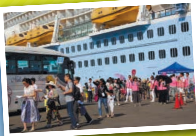
約4,000人の乗客が大型バスで観光地へ

八代港では、大型クルーズ船受け入れの機能強化を図るため、防舷材・係船柱の施設整備を実施するとともに、安全に入港するための運航ルールなど環境整備を進めています。