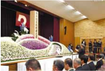
犠牲者追悼式(県庁地下大会議室)