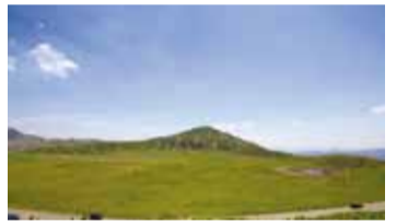
阿蘇・草千里ヶ原