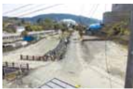
公費解体完了後の状況