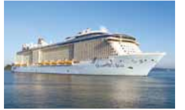
クルーズ船(クアンタム・オブ・ザ・シーズ)