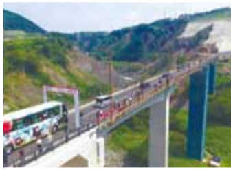
長陽大橋