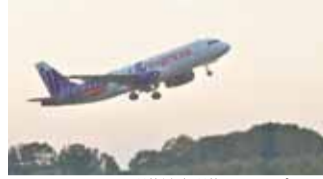
香港線(香港エクスプレス)