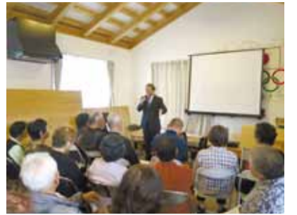
仮設団地で知事がすまいの再建支援策を説明