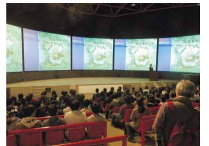
阿蘇火山博物館で地震の教訓を学ぶ教育旅行の生徒

阿蘇の観光復興は、重要な課題のひとつ。「阿蘇火山博物館」では、グループ補助金を活用して施設を復旧し、今年10月にグランドオープンしました。教育旅行生向け震災学習プログラムなど、新しい取り組みも行い、復興に向けて着実に進んでいます。