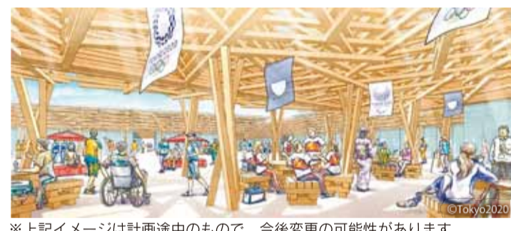
※上記イメージは計画途中のもので、今後変更の可能性があります

県産森林認証材が、東京オリ・パラ組織委員会が実施する選手村ピレージプラザの建設プロジェクトに活用されます。