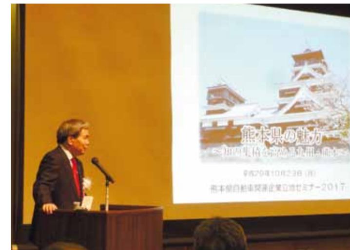
熊本県自動車関連企業立地セミナー2017 in名古屋の開催

知事が、自動車産業の一大集積地である東海地方で、熊本地震からの創造的復興や熊本への企業進出のメリット、魅力についてPRすることにより、熊本への企業誘致を進めています。