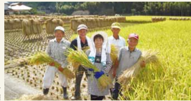
地域で力を合わせ大切に育てた鶴喰米の収穫

「未来のために今できること」をキャッチフレーズに、自分たちで集落を守り、米作りをはじめ、アスパラガスやニンニクなどの高単価作物による収益向上に取り組んでいます。