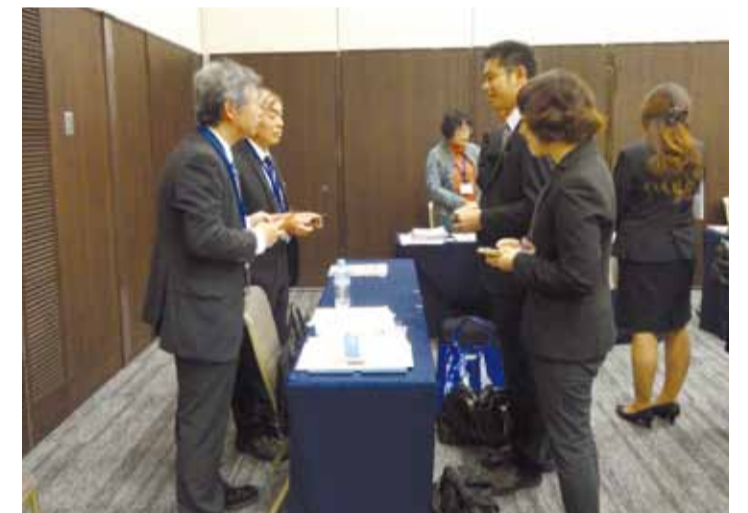
大学側と企業側の情報交換の様子

企業の人材確保が厳しくなるなか、県内企業の魅力をPRする情報交換会を開催しました。企業側は、国内外の優良顧客との取引実績や若手社員の活躍事例を紹介し、新卒者の県内就職につながるよう熱心にアピールしました。