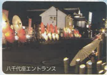
八千代座エントランス

「山鹿灯籠浪漫・百華百彩(ひゃっかひゃくさい)」は、国指定重要文化財である芝居小屋「八千代座(やちよざ)」から旧豊前街道にかけた歴史的な街並みに、灯籠と番傘を使った灯(あかり)のモニュメントが美しく並び、幻想的な灯りが人々の目を楽しませてくれる冬の灯りの祭典です。日本観光協会の2007年「優秀観光地づくり賞」を受賞しました。