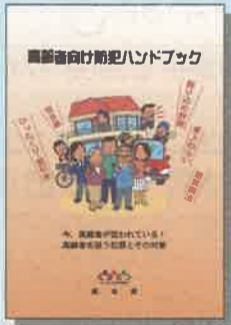
高齢者向け防犯ハンドブック

ひったくり対策や振り込め詐欺対策など、お年寄りの方々が被害に遭いやすい犯罪の対処方法が分かります。