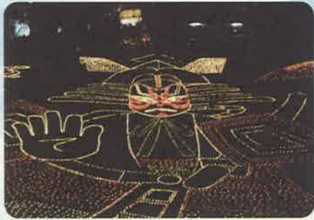
昨年描かれた歌舞伎役者の地上絵

菊池市では、毎年11月に火の祭り“菊池の灯り”「万華灯(まんげとう)」が開催されます。紙コップの中に立てたろうそく5万本で、約100メートル四方にわたり光の地上絵が描かれます。この祭りは、「子どもたちの想い出づくり」と「新しい菊池の風物詩づくり」をしたいとの思いから