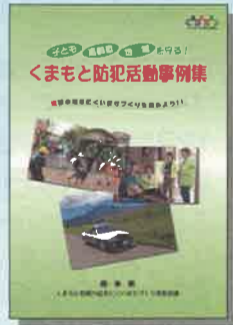
くまもと防犯活動事例集

ひったくり対策や振り込め詐欺対策など、お年寄りの方々が被害に遭いやすい犯罪の対処方法が分かります。