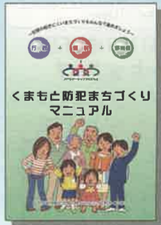
くまもと防犯まちづくりマニュアル

「安全安心」は暮らしの原点です。誰もが安全に安心して暮らすことができるまちづくりを一緒に進めていきましょう。