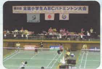
全国小学生ABCバドミントン大会の様子

皆さんに楽しんでいただけるようなスポーツ大会などを誘致するため、さらに力を入れていきますので、大会やイベント開催の機会には、ぜひ八代でトップレベルの技をご覧ください。詳しくは、下記のお問い合わせ先まで。