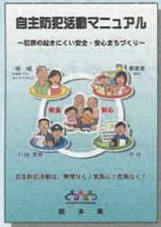
自主防犯活動マニュアル

空き巣対策や子どもの安全対策、悪質商法対策など、身近に起こりやすい犯罪の対処方法が分かります。