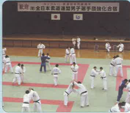
全日本柔道連盟男子選手団強化合宿の様子

八代市では、九州新幹線や高速道路などの交通の利便性を生かしながら、トップレベルのスポーツ大会などの誘致を進めているところでは、今年7月には、9月に開催された世界柔道選手権と来年の北京オリンピックに向けた「全日本柔道連盟男子選手団強化合宿」が開催され、約5,600人の観客が選手たちに声援を送りました。