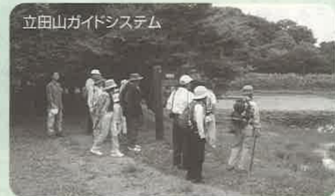
立田山ガイドシステム