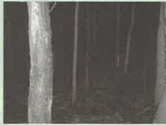
林内が暗く下草も生育しておらず、森林の機能が低下していました

森林所有者との協定に基づき、強めの間伐（かんばつ）を行い、針葉樹と広葉樹が混ざった自然に近い森林づくりを進めています。昨年度は県下32市町村で1,024ヘクタールの森林の間伐を行うことができました。この間伐によって、森林のもつ水源のかん養などの公益的機能が、十分にその機能を果たせるようになります。（針広混交林化促進事業）