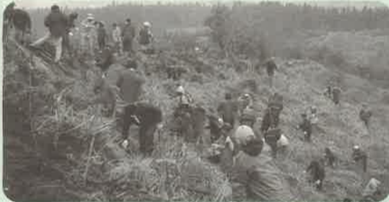
上下流連携森林整備促進事業