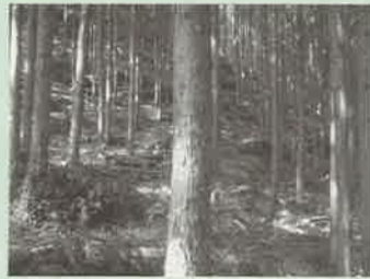
林内に光が入るようになり、下層の植物が生育できる環境ができました