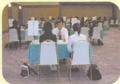
学生と企業との面談会

インターンシップは、学生の企業に対する理解や職業意識が深まり、人間的成長につながると思いますし、企業が学生に何を求めているのかも分かります。こうしたインターンシップなどを通して、皆さんが将来について、真剣に考えてほしいと思います。