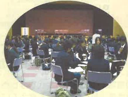
熊本学園大学での「集団面接講座」

ジョブカフェくまもとを管理運営する(財)熊本県雇用環境整備協会では、国からの委託を受けて、就職活動を行う大学生向けの「集団面接講座」や、高校生が県内事業所を見学し、業務の説明を受ける「高校生企業見学」なども行っています。