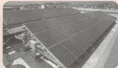
太陽光発電(熊本県立大学)