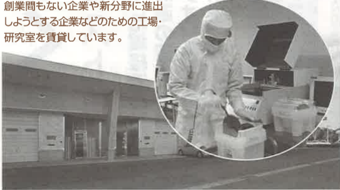
ソニーセミコンダクタ九州(株)熊本TEC

創業間もない企業や新分野に進出しようとする企業などのための工場・研究室を賃貸しています。