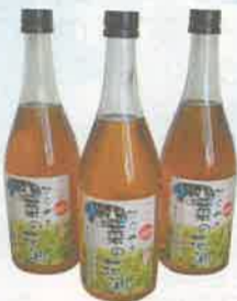
菜の花からとれた菜種油