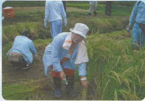
農村体験ツアーの稲刈り

平小城地域は、山鹿市の奥座敷として1200年の歴史があり、良質な温泉として人気が高い「平山温泉」、2002年九州米サミットで最優秀賞を受賞した「菜の花米」などの四季折々の農産物などに恵まれています。また、全国的に有名な「チブサン古墳」をはじめとした数々の史跡も点在し、自然と歴史の魅力がいっぱいの地域です。