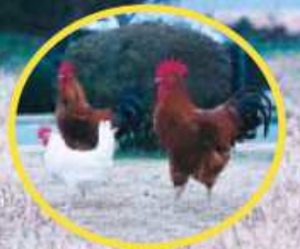
天草大王の雄は、背丈が90センチメートル、体重が6キログラムになるものもいます。