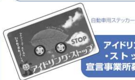
自動車用ステッカー