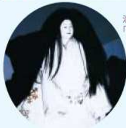
清和文楽 「雪おんな」