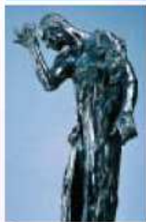
「カレーの市民」より

■県立美術館本館(熊本市) ☎096-352-2111 http://www.pref.kumamoto.jp/insitution/museum