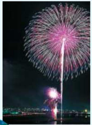
全国花火競技大会