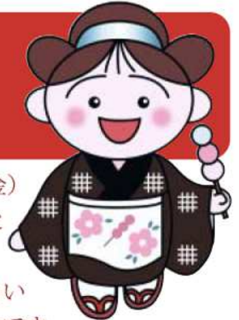
マスコット「おてもちゃん」