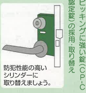
防犯性能の高いシリンダーに取替えましょう。

A ピッキングとは、針金のような特殊な金属棒を使って、鍵をこわさずに短時間にドアを開ける侵入方法のことです。近年、関東地方の都市部のマンションやアパートなどで被害が急増しており、全国に波及しています。 熊本県内では、平成十二年は二十一件、平成十三年は十二件と、まだ少ない状況ですが、今後、犯行が増加する可能性も十分考えられます。 ピッキング犯罪を防ぐためには、次のような方法が効果的です。