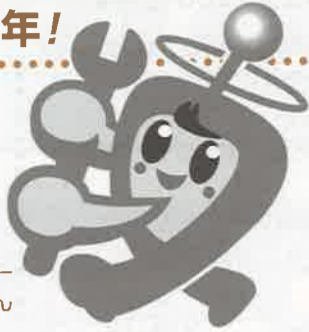
大会キャラクター テクちゃん

来年10月、技能五輪全国大会と全国障害者技能競技大会(アビリンピック)が熊本で開催されます。