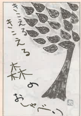
平成12年度 絵てがみ部門最優秀賞 [耳をすますと...]

お問い合わせ先 熊本県林政課 政策班 〒862-8570 (県庁専用郵便番号) ☎096-383-1111 (内線5594) FAX096-385-5814 電子メール rinsei@pref.kumamoto.jp