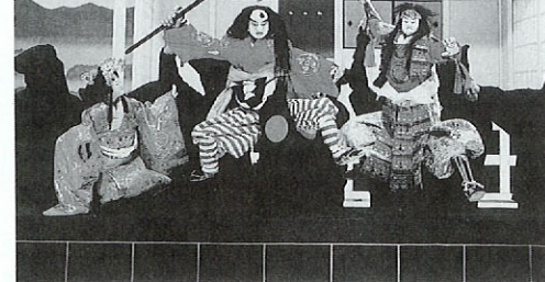
ゴールデンフェスタ