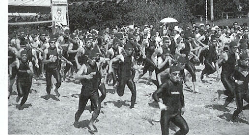
天草国際トライアスロン大会