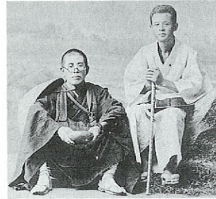
山頭火(左)熊本の句友と