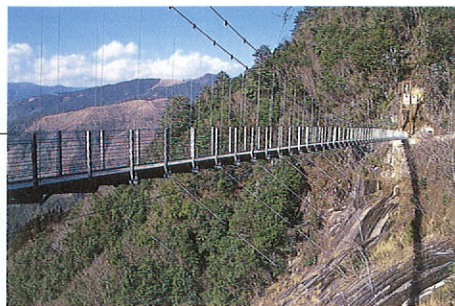
「白水滝」 球磨川水源に上る途中にある滝で、荒々しい雄滝と美しい曲線の雌滝の夫婦滝になっている。それぞれ白龍王橋、白龍妃橋の吊り橋が掛かり、上から眺める景色の美しさは圧巻。 (写真は白龍妃橋)