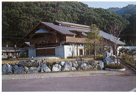
「山江温泉健康センター」 山江村の古い民家や神社の良さとコンクリートの壁を組み合わせた建物。露天風呂、エステ湯、うたせ湯など7つの健康風呂があり、食事や休憩もできる。隣接する「はたる亭」は栗やヤマメなどを使った料理が自慢の情緒あふれる宿。