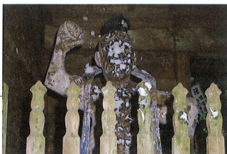
「谷水薬師」 日本七薬師の一つに数えられ、健康に御利益があるといわれる。紙を噛んで紙つぶてを作り、仁王尊に向かって自分が病んでいるところに投げ付け、うまくくっつくと病気が治るというユニークな風習がある。