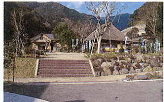
五木子守唄公園 五木地方の子守唄も伝承の一つである。「五木子守唄」はここの子守唄にちなんで名づけられた公園だ。千石級の険しい山々が連なるこの地方では、貧しい農家の娘は口べらしのため子守奉公に出された。我が身の不幸や子守の辛さを嘆いたこの子守唄は歌詞もメロディも様々にあるという。園内に子守唄をテーマにした彫刻があちこちに立つ。青い空を見詰めているそれらの彫刻は、やっとな故郷へ帰ってきた娘たちのような感じだ。