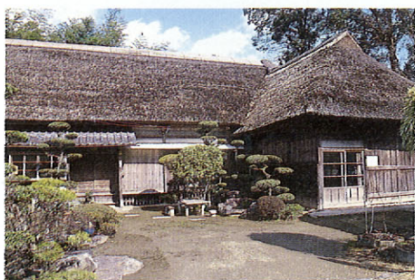
「桑原家住宅」 人吉・球磨地方に多く見られる釣屋型の民家(国指定文化財)。その建築様式から江戸時代末期に建てられたと推測される。「ざしき」をはじめとする三室と「だいどころ」と「土間」の二室を直角につなげた形が特徴。

春に誘われてやって来た 風のように気ままな旅人に 大地が山が川が話してくれた物語