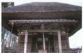
生善院観音堂(猫寺)

霊は本当にうらめしそうな顔を している。幽霊が 出たという湧水 池を見に本堂の 裏へ回る。水蓮の 葉が水面を覆う 池はシンと静ま りかえっている。