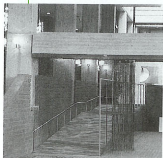
●エントランスホールから モールへスロープ設置 正面入り口から事務所へ行く通路にある階段の横にスロープを設けます。