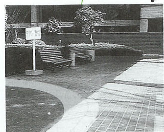
●乗用車乗降場の段差解消 正面玄関から建物へ入る際、乗用車等の乗り降り面から、車イスでそのまま進むことができるようになります。