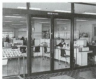
●事務室入り口、裏玄関の自動扉設置 車イスなどで入館する場合、障害となっていた手動の開閉式扉を自動扉に替えます。

県は先に発表した新県計画に基づき、「高齢者・障害者にやさしいまちづくり事業」として、公共建造物の改修を進めています。その一つ、県立劇場では、これまで車イスでの来館に障害となっていた段差や手動扉などが改善されたり、体感音響装置や難聴者用磁気誘導ループが導入されることになりました。「こころコンサート」は、皆さんの温かい心とこのような施設の整備があいまって初めて実現できると言えるのでしよう。