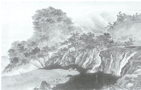
矢部手永 南中島村カバノ木滝