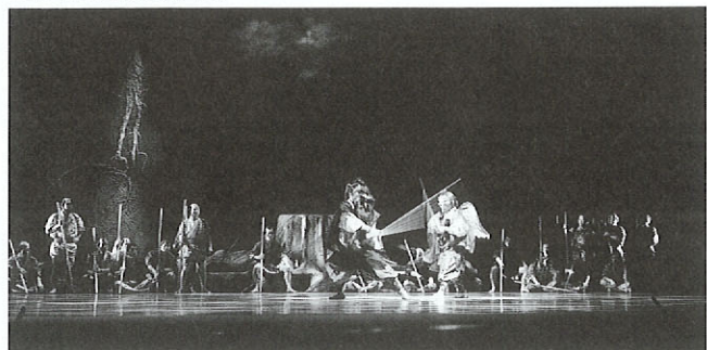
平成3年2月16日 文政三年棒踊り