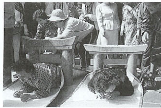
粟島神社春季大祭