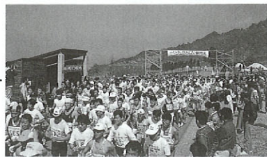
大阿蘇クロスカントリー