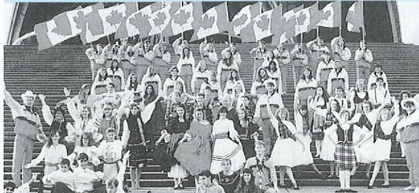
カルガリーユースシンガーズ