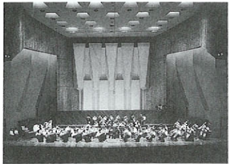
アジアユースオーケストラ