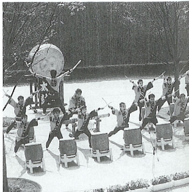
鹿央夏祭り「炎の祭典」