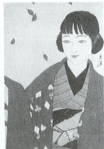
今西コレクション名作と拾遺展 (山川秀峰・婦女四題「秋」)