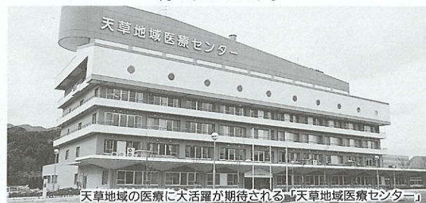
天草地域の医療に大活躍が期待される「天草地域医療センター」

この病院は、天草都市医師会が本渡市亀場町に開設するもので、鉄筋コンクリート6階建ての建物に、200床(オープン時は136床、平成6年に200床)を配置し、24時間体制の救急医療や、地域の病院、診療所と連携した開放型病院として、ガンその他の悪性新生物や循環器疾患等の高度、専門的医療を実施していく予定であり、天草地域の医療水準の向上が期待されています。