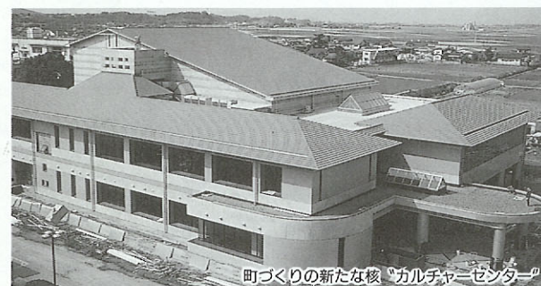
町づくりの新たな核「カルチャーセンター」