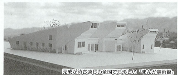
完成が待ち遠しい全国でも珍しい「まんが美術館」

日本政治漫画家の三羽ガラスと称された、故那須良輔画伯の原画展示場(常設)や各種の催事に使用する特別展示場を備えており、漫画文化の情報発信基地になりそうです。