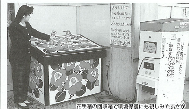
花手箱の回収箱で環境保護にも親しみやすさが

市と町内会が協力し、全市的にアルミ缶のリサイクルを進めるのがねらい。空き缶売却による益金は、そのまま町内会活動資金に充てられます。