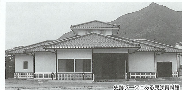
史跡ゾーンにある民族資料館