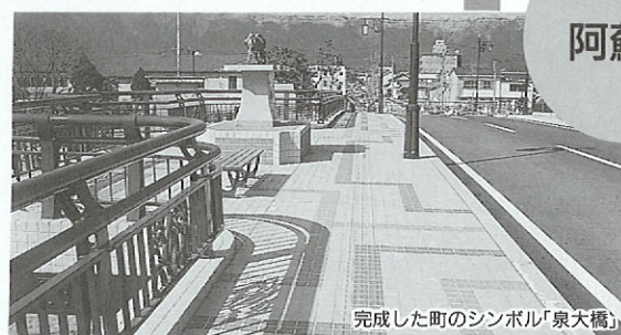
完成した町のシンボル「泉大橋」