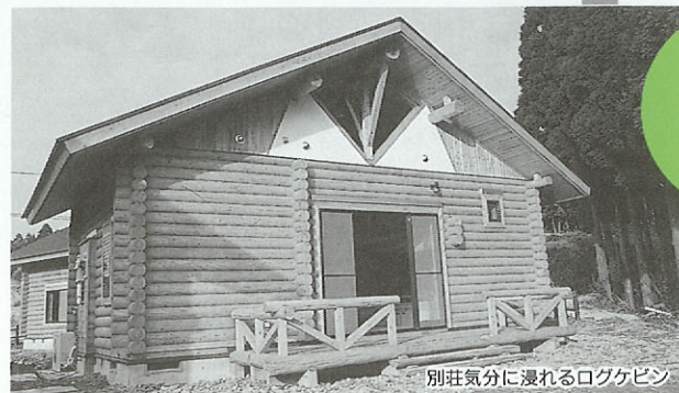
別荘気分になれるログケビン