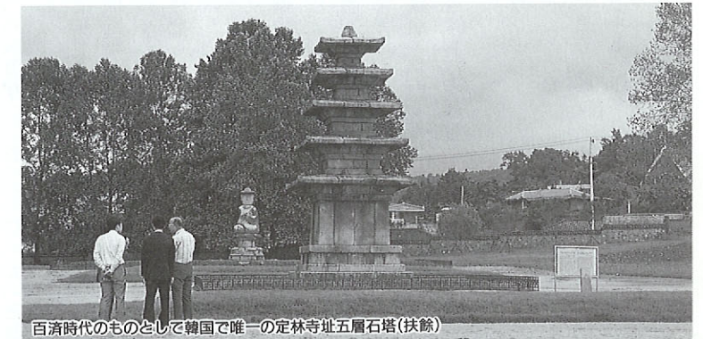
百済時代のものとして韓国で唯一の定林寺址五層石塔(扶餘)

今回は、古代、百済の都があった頃から交流を行っていたといわれる忠清南道との姉妹提携交流をレポートします。