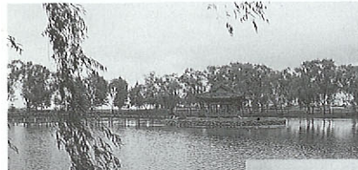
百済時代の宮廷庭園の一つ「宮南池」(扶餘)