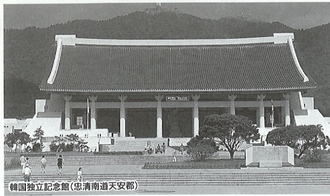
韓国独立記念館(忠清南道天安郡)

去る八月十七日には、高校生による第七回日韓親善スポーツ交流競技会が本県で開催されました。これは一九八五年から毎年、若い世代の友好を深めようと、熊本と忠清南道で交互に開かれているものです。こうした交流の積