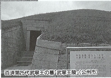
百済第25代武寧王の墓「武寧王陵」(公州市)

れていません。新羅が侵略した際に百済のものを破壊し尽くしてしまったり、残る史料も日韓併合時代に日本に渡ってしまったからだといえます。今、忠清南道では、これらの地域を百済文化圏として整備保存し、地域振興の核にしようと事業を進めています。