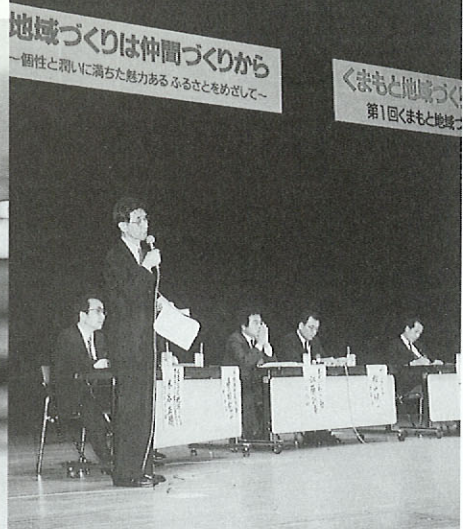
くまもと地区づくりフォーラム

くまもと日本一づくり運動が展開されて七年。各地に地域づくりの運動家やグループが誕生し、様々な活動を展開しています。