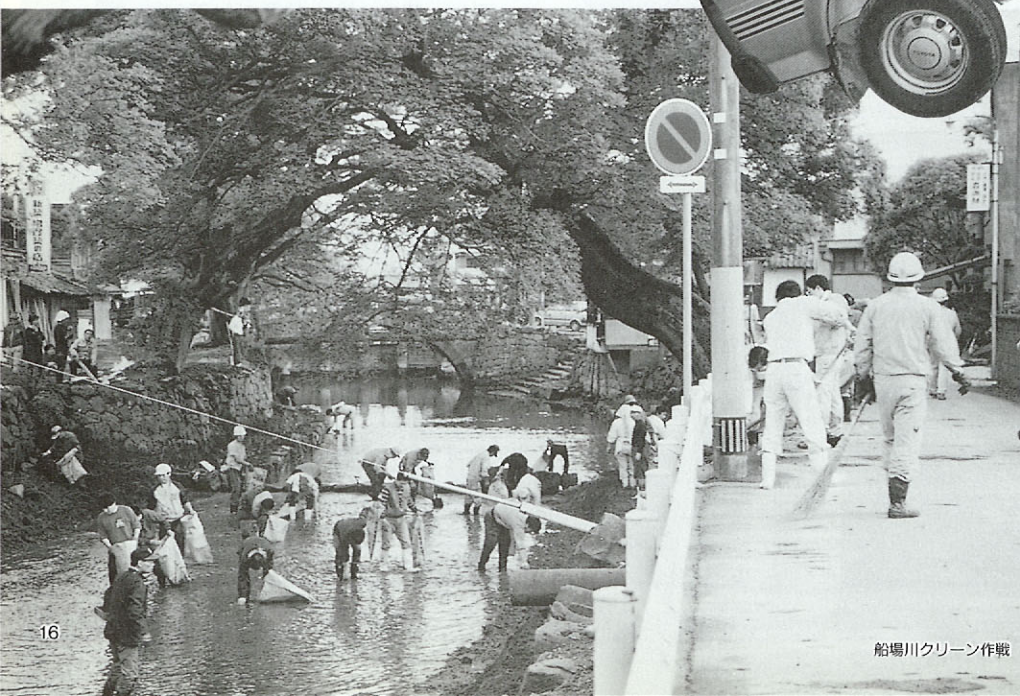
船場川クリーン作戦