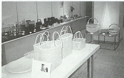
クラフトマン18人展

お問い合わせ(096)324-4930 2月6日(水)～2月11日(日) クラフトマン18人展—10年使えば愛用品— ～3月31日(日) 肥後の白磁 高浜焼展—今、映える染付色絵—