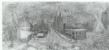
第三期収蔵品展より

お問い合わせ(096)352-2111 ～2月3日(日) 1階展覧会場 太田記念美術館名品展 ～2月11日(月) 2階展覧会場 第二期収蔵品展 2月14日(木)～3月3日(日) 1階展覧会場 院展 2月16日(土)～3月28日(木) 2階展覧会場 第三期収蔵品展