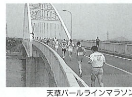
天草パールラインマラソン

3月15日(金)～21日(木) 阿蘇の火まつり お問い合わせ(096)22-0046 阿蘇広域市町村圏協議会