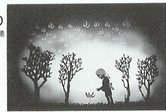
シルエット劇団まつぼっくり

3月24日(日) 玉名市民会館 シルエット劇団まつぼっくり お問い合わせ(096)363-2233 県立劇場