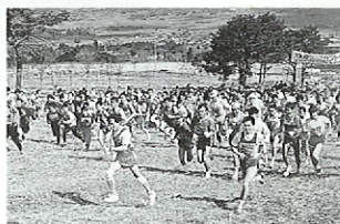
大阿蘇クロスカントリー

お問い合わせ(096)7-1161 3月17日(日) 大阿蘇クロスカントリー ホップステップ・スプリング