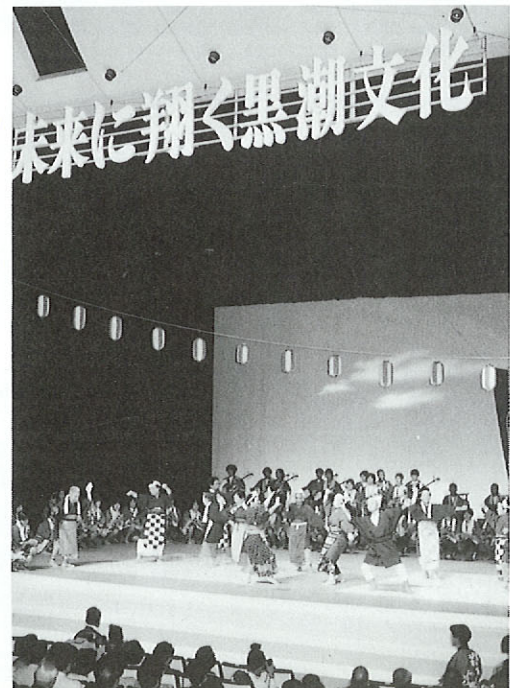
県民文化祭第3回 天草（写真は牛深会場）