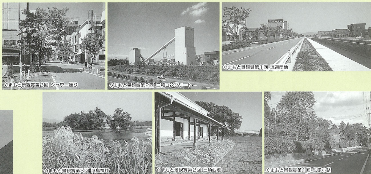
くまもと景観賞第2回 シャワー通り