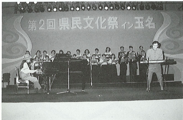
県民文化祭第2回 玉名 菊池川にちなんだテーマ曲「川の流れに」の演奏