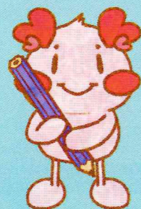
ゆうあい中キャラクター ゆあちゃん