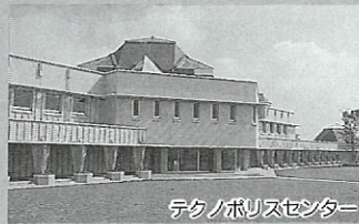
テクノポリスセンター