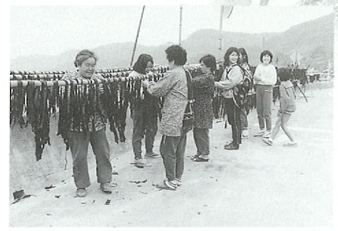
わかめ干しが見られるようになると、もう春。