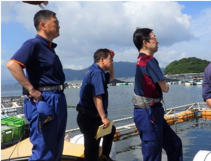
魚類養殖の現場を視察