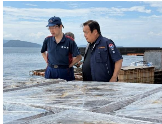
へい死魚処理の状況を視察