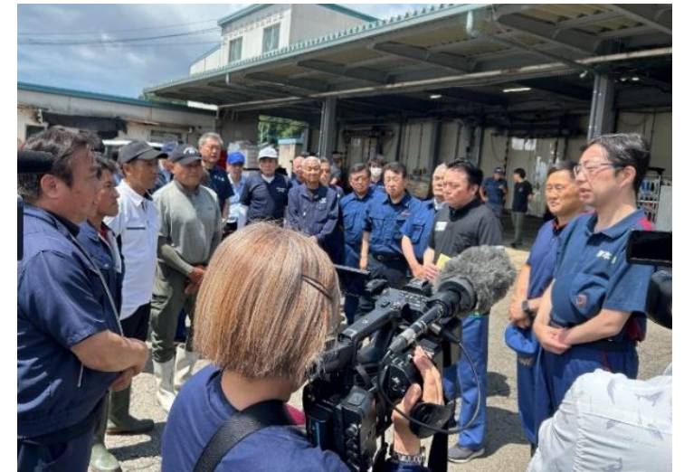
養殖業者等との意見交換