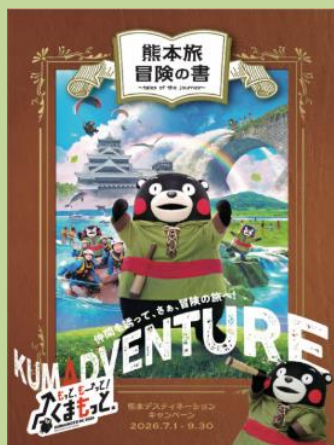
公式ガイドブック

現在配布中の熊本DC公式ガイドブックや 公式ホームページ・SNSで、 熊本DCの情報を発信しています！