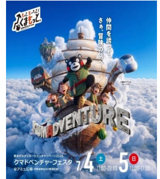
オープニングイベント 告知ポスター