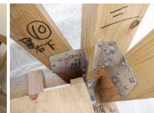
接合部を金物で補強