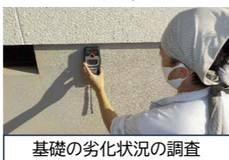
基礎の劣化状況の調査