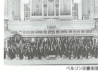
ベルリン交響楽団

10月24日(月) 7:00~10:30 グランドチャンピオンゴルフクラブ 第3回にしはらむらおこしオープンゴルフ大会 お問い合わせ(096)278-3111 西原村役場企画室