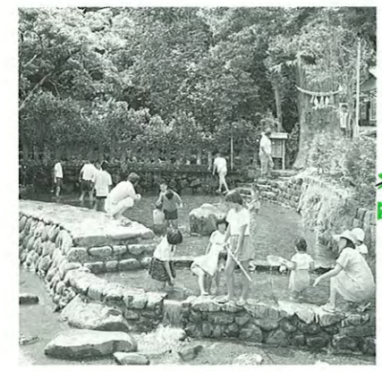
江戸時代から引き続き利用されている日本最古の上水道轟水源。