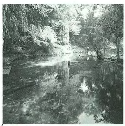
阿蘇と別府を結ぶ国際観光ルート瀬の本高原の山ひだに湧く池山水源。