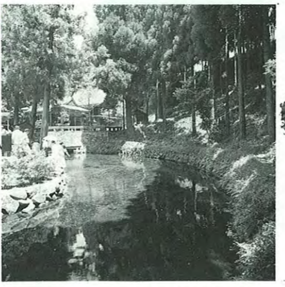
毎分60トンの清らかな水が湧き続ける白川水源。