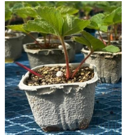
ポリポットを紙ポットに代替