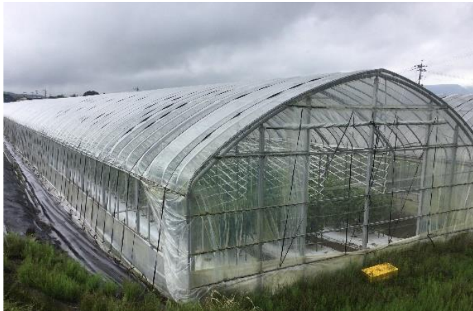
園芸用ハウスの被覆フィルムの再利用