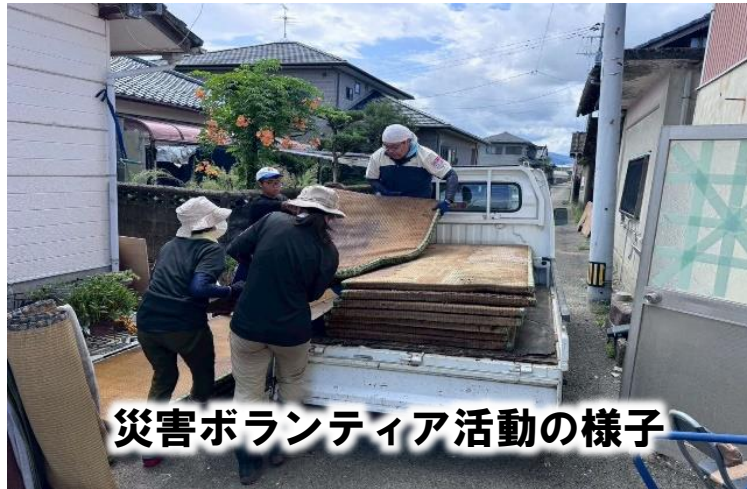
災害ボランティア活動の様子