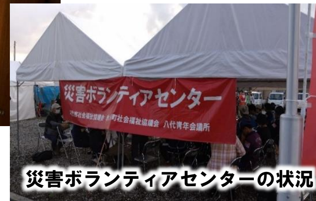
災害ボランティアセンターの状況