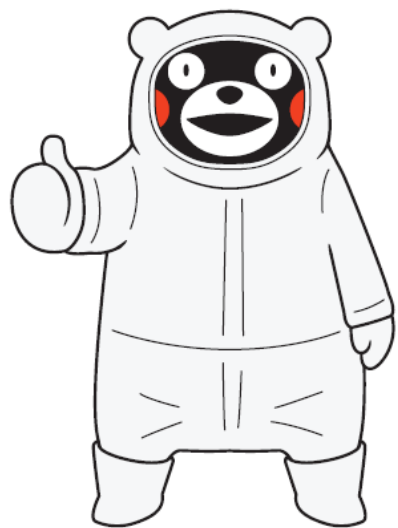
クリーンスーツを着たくまモン