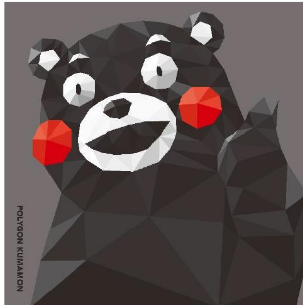
ポリゴンくまモン