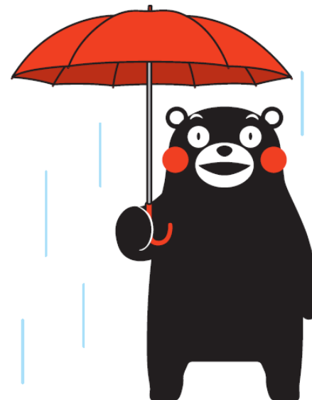
傘を持ったくまモン