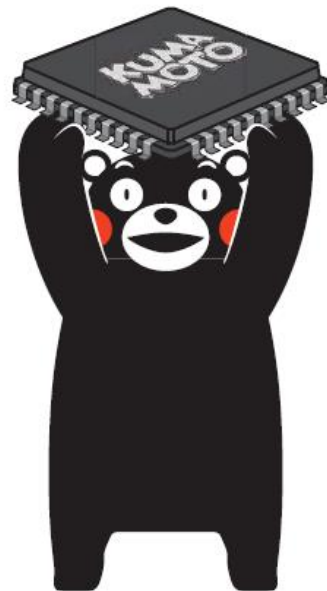
半導体チップを持ったくまモン