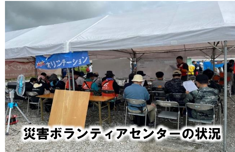
災害ボランティアセンターの状況