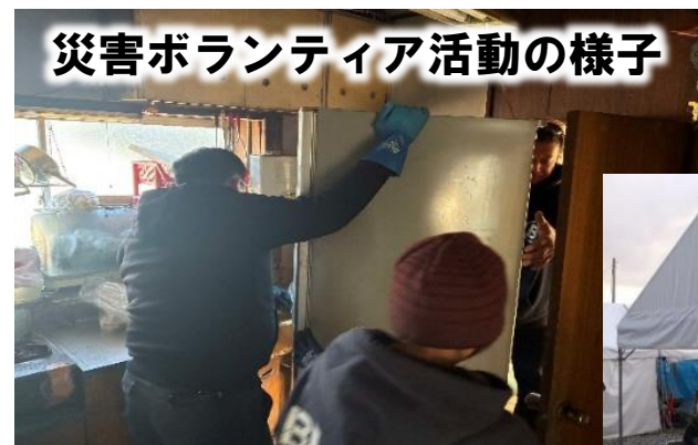
災害ボランティア活動の様子