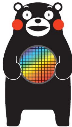
半導体ウエハを持ったくまモン