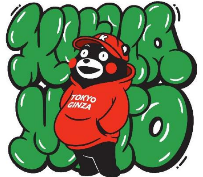
グラフィックアートくまモン