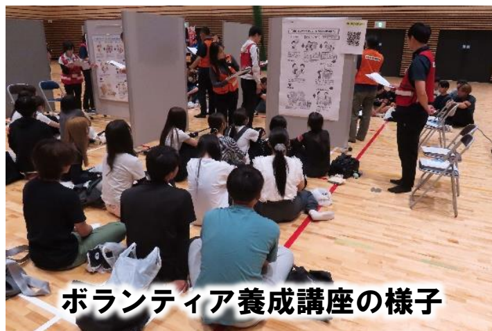
ボランティア養成講座の様子