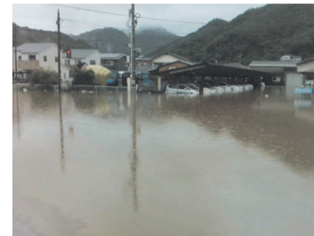
▲令和7年8月豪雨で浸水した住宅街