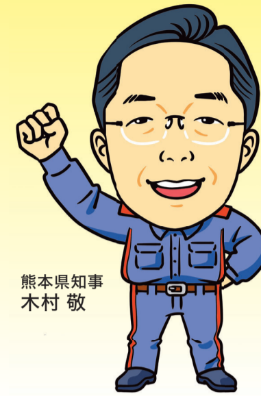
熊本県知事 木村 敬