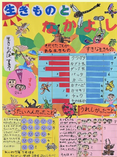
第73回 特別賞(全国コンクール佳作)

共 催：熊本県・熊本県統計協会 後 援：熊本県教育委員会 熊本日日新聞社・NHK熊本放送局・熊本放送・テレビ熊本・熊本県民テレビ・熊本朝日放送 協 賛：鶴屋百貨店