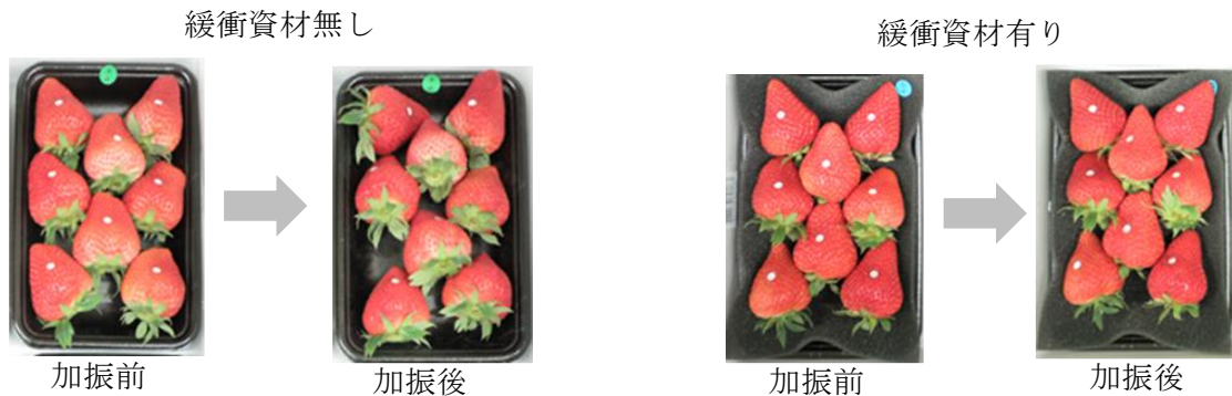
図1 緩衝資材の有無と果実の動き方

注4) 総合評価: 着色程度10.0以下、1果あたりのガクの萎れ発生率、損傷率10%以下の3項目をすべて満たすものを○、満たさないものを×の2段階で評価した。品質保持目安を満たさないデータは、網掛けで表示。