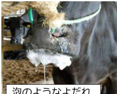
泡のようなよだれ