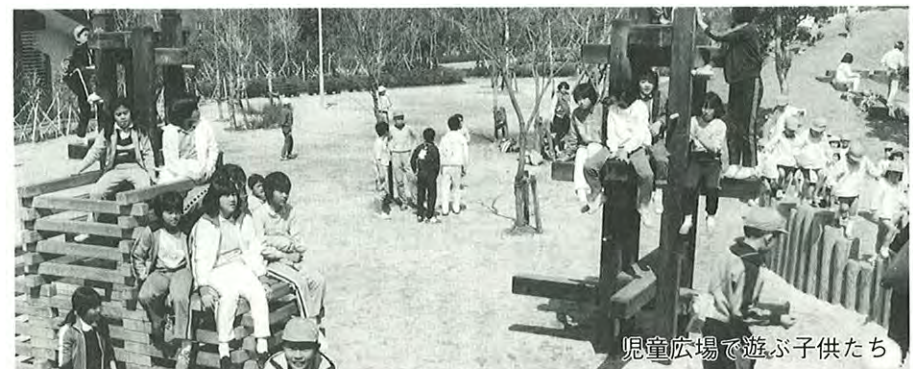
児童広場で遊ぶ子供たち

思いのスポーツに汗を流したり、子ども達とのんびりと遊ぶ家族連れで終日にぎわったとのこと。過去で一日の利用者の最高は二万五千人とか。想像してみても、どんなに壮观なことだったでしょう。各職場の運動会や地区運動会にもよく利用されるとのこと。 各競技場が次々に完成して利用し始めた五十二年五月から現在までの利用者数は、推定二百万人となっています。 園内を一巡して驚いたのは、先ず広いこと。ちり箱が一つも置かれていないのに、ちり、空かん等は必ず持ち帰ることが守られて、きれいなこと。十六万本の木が実に見事に植え込まれ、その手入れが行き届いていることでした。 年々楽しむためのスポーツ、健康のためのスポーツが盛んになり、それに伴って中高年の体力が、六、八歳も若返っているといわれます。 抜けるような秋空を見上げていると、この広々とした自然の中で、思い切って手足を動かして運動したり、疲れたら、芝生でのびのびと休んだりしてみたい……そんな気持ちにさせる楽しい場所です。 ジョギングコース・サイクリングコースや神園山の展望台も十一月に