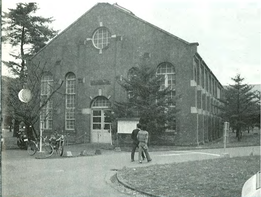
伝統ある熊本大学工学部資料館

一、九州の中央に位置した地理的優位性から、九州財務局、郵政局、農政局など広域機能を持った国の出先機関が多く、行政、文化、