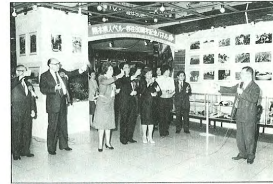
■移住80周年記念「ペルー展」

高森町の南阿蘇国民休暇村内に、この程南阿蘇ビジターセンターが建設され、4月27日に落成式が行われた。館内では、パネルやビデオ、マルチスライドなどを使って阿蘇国立公園に関する情報や阿蘇の自然と人々の生活などをわかり易く紹介している。