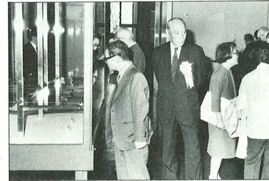
■第十三回永青文庫展

国際化社会に向けて建設が待ち望まれていた熊本空港国際線ターミナルビルが、4月27日に竣工式を迎え、国際線利用客の利便が一段と図られた。