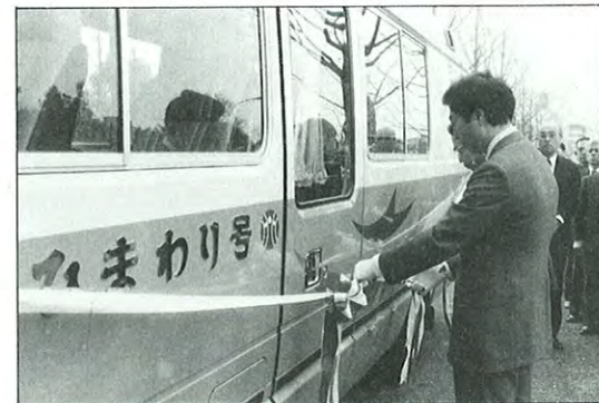
■栄養指導車新「ひまわり号」スタート

婦人の立場から人づくり・国づくりに取り組むため、日本の文化や教育などを学ぼうと、新生ベラウ共和国(パラオ)から大統領夫人を中心とする婦人代表団一行が来日。4月13日に熊本入りし、細川知事を表敬訪問した。