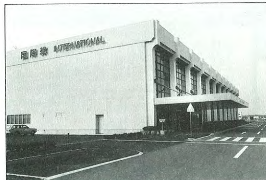
■国際線ターミナルオープン

県民の健康づくりに活躍してきた栄養改善指導車「ひまわり号」が新型車とパトタッチし、3月29日に命名式が行われた。家庭の台所器具一式を乗せた新「ひまわり号」は、主に城南地区を巡回指導する。