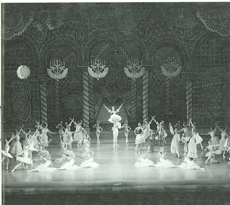
3月27日には、演劇ホールで落成記念としてクラシック・モダンバレエ合同公演が行われた。

「それなのよ、この調子で行ってたら我家の教養娯楽費は、もう年間予算をオーバーしそうなのヨ」とうれしい悲鳴が私の周りで聞かれます。