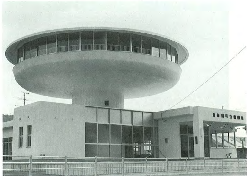
▲展望式閲覧室を備えた御所ノ浦町立図書館は、町の文化その他の発展に役立つようにとの願いを込めて4月12日に落成した。

木原不動尊は、成田・目黒と並ぶ日本三大不動尊の一つ。大祭は、毎年2月28日と10月28日にあり、御本尊を開扉しての法要のあと、本堂前では、無病息災を祈り「採灯護摩祈祷」「火渡り」「湯立て」の大荒行が行われる。