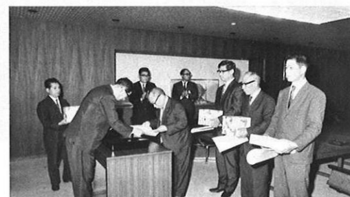
9・22-身障者雇用優良事業所の県知事表彰と身障者で模範社員である個人に対する労働大臣表彰の授与式が行われた。