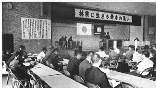
10・11-林業に生きる若者の集いが県庁大会議室で開かれ、青年の主張発表や講演などで賑った。