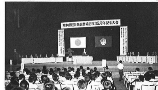
9・1-県経営伝習農場の創立35周年記念式典が、卒業生約2,000人を集めて開かれた。(熊本市市民会館)