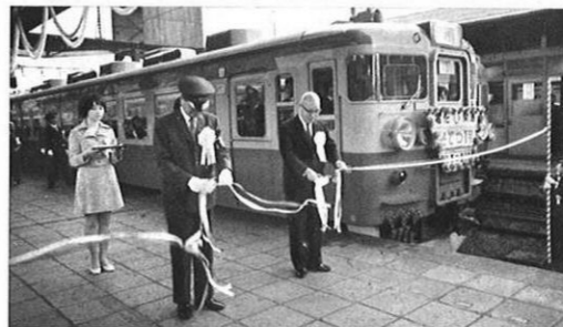
10・1-国鉄鹿児島本線の熊本-鹿児島間の電化が完成。秋の新ダイヤ改正とともに1日から電車運転が始まった。