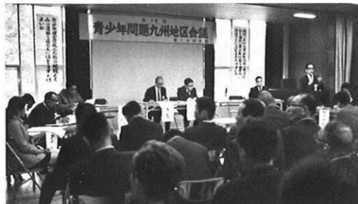
10・7-九州地区の青少年が集り、青少年問題を研究討議する第19回青少年問題九州地区会議が県庁ホールで開催。