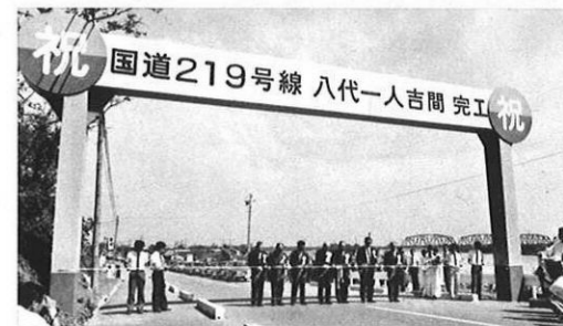
8・31-球磨川の沿岸を走る八代-人吉間の国道219号線が改良、全面舗装を完了した。