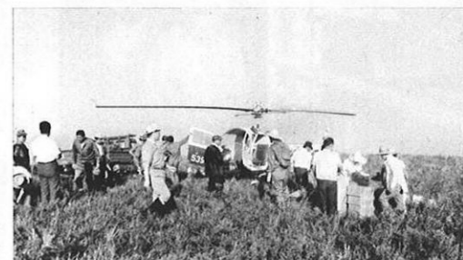
9・29-ヘリコプター利用による草地造成試験が阿蘇郡西原村の牧野で行なわれた。主に殺虫剤・肥料・牧草種子など。

県政ハイライト★KENSEI HAI RAITO★けんせいはいらいと★県政ハイライト★