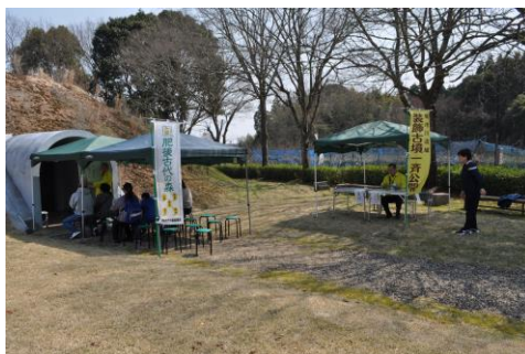
(熊本県立装飾古墳館提供) 装飾古墳一斉公開 (横山古墳)