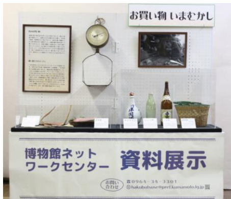
「お買い物いまむかし」どこでもミニ移動展示用パッケージ