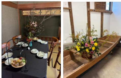
アフタヌーンティーイベント等