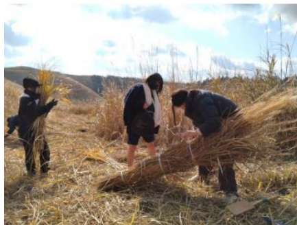
カヤ束づくり