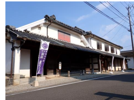
徳富蘇峰・蘆花生家