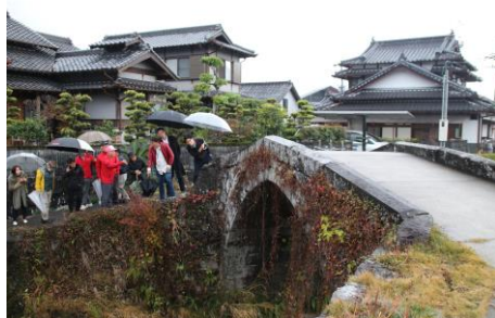
第3回講座「御船町の石橋」バスツアーの様子