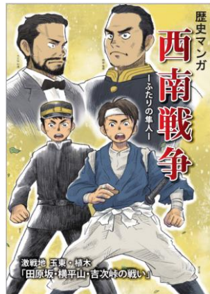
歴史漫画西南戦争—ふたりの隼人—