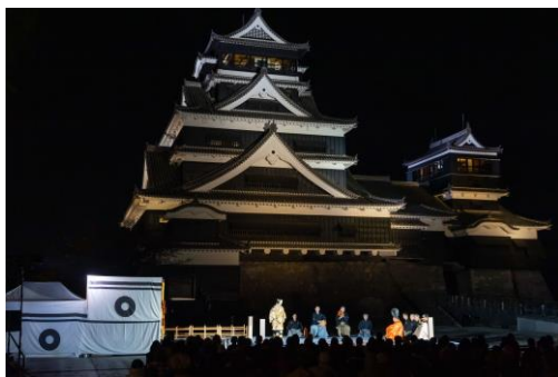
(公益社団法人能楽協会提供) 能「葵上」上演の様子