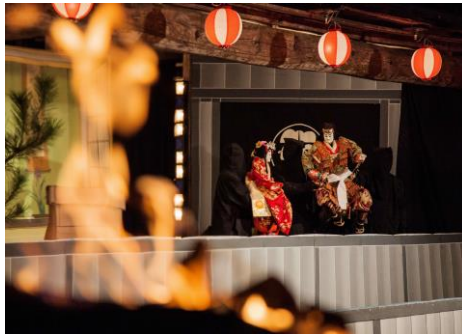
薪文楽の公演風景 (「鎌倉三代記」)