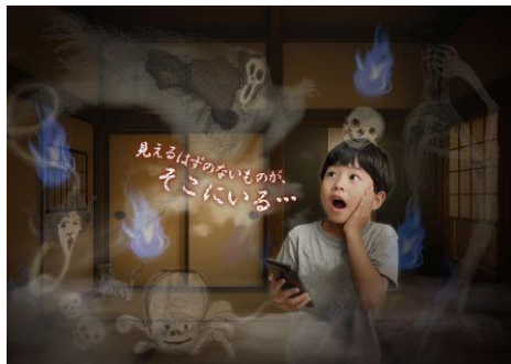
AR展示イメージ

URL https://www.city.kumamoto.jp/list00623.html