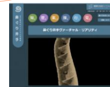
鼻ぐり3Dモデル

県史跡「馬場楠井手の鼻ぐり」の3Dモデルは、菊陽町文化財ツーリズムで公開中です（URL： https://www.kikuyotsu-rizumu.jp/ ）。