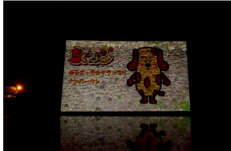
プロジェクトンマッピング投影状況