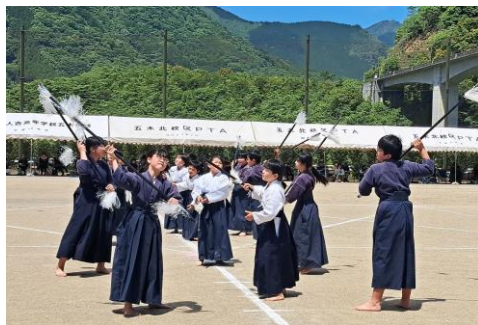
運動会で披露される棒踊り