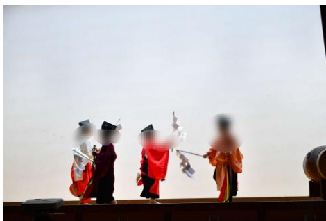
体育館のステージで神楽を披露する児童たち