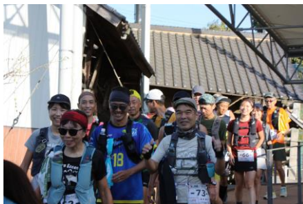
谷川展望広場を駆けける参加者

URL https://tanido.wixsite.com/iidasan-trail