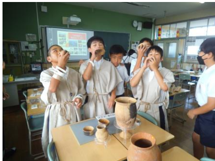
出前授業風景

菊池川流域日本遺産協議会 文化財保存活用推進部会 令和7年度部会長 山鹿市文化課