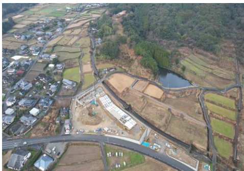
棚底城跡と建設中の天草戦国ミュージアム

URL https://www.city.amakusa.kumamoto.jp/list00038.html