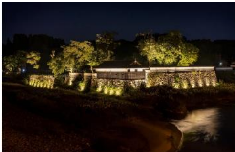
国史跡人吉城跡ライトアップ状況

・動線上にある段差などのバリアが一部暗く、観光演出だけでなく歩行者の安全確保の必要性も確認できた。