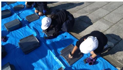
葺替瓦へ名入れをする様子

URL https://www.city.uki.kumamoto.jp/toppage/soshiki_list/2018751