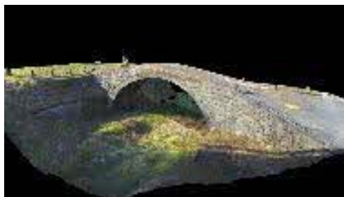
(熊本県提供) 中山手永における石橋群・薩摩渡

URL https://www.pref.kumamoto.jp/soshiki/125/