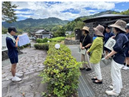
東陽中学校のボランティアガイド

URL https://www.instagram.com/toyomachikyou?igsh=aHp0OGJtN3RhcMn2