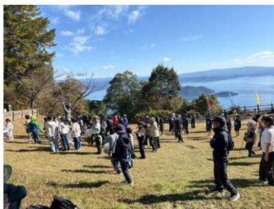
龍ヶ岳山頂での様子