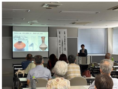
(あさぎり町提供) 文化財講座（座学）の様子