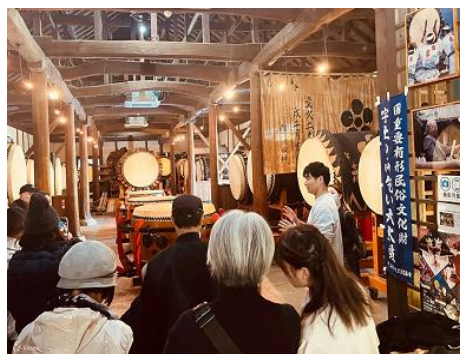
観光コンテンツ造成のためモニターツアーを実施