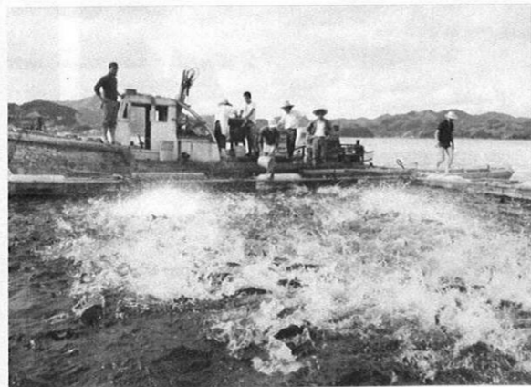
▲2、3年もののハマチは出荷も真近かだ。順調に成長したハマチを前に話しもはずむたのしいひととき。