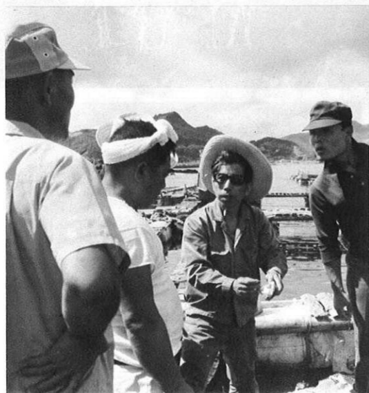
▲養殖場で、魚を手にとって指導する。なごやかな中にも真剣な対話がかかわされる。

牛深市中心部の地価より高い海水面の賃借料を払ってのハマチやタイの養殖だけに漁業経営者は真剣だ。機会あるごとに「経営改善をどうするか」「肉質や味の向上をよくするには?」「種苗センターを設置してほしい」……と漁民との熱心な対話がかかわされる。そして、「将来は、漁場の再編成、合理化による大規模養殖、さらには石ダイの放流なども行ない、タイの特産地を形成したい」と漁民と指導員の夢は果しくなく広がる。