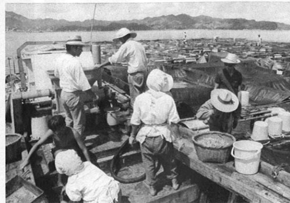
▲エサが少しでも古いと病気のもとになる。巡回の時はエサの質を見るのも仕事の一つ。