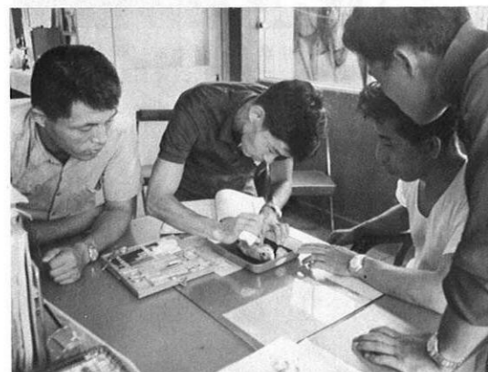
▲養殖業者から持ち込まれたタイを解剖して、病気に対する処方などについて討議・研究する。